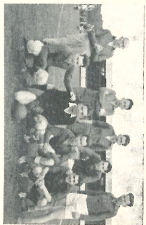
Het nog onvolledige kantoor-elftal.

Een verrassend schot van Bredelind werd weer gestopt, maar het bazen-doel bleef onder druk. Links binnen Van Weert probeerde het met een ver schot dat doelman Sien slechts met moeite wist te keren.