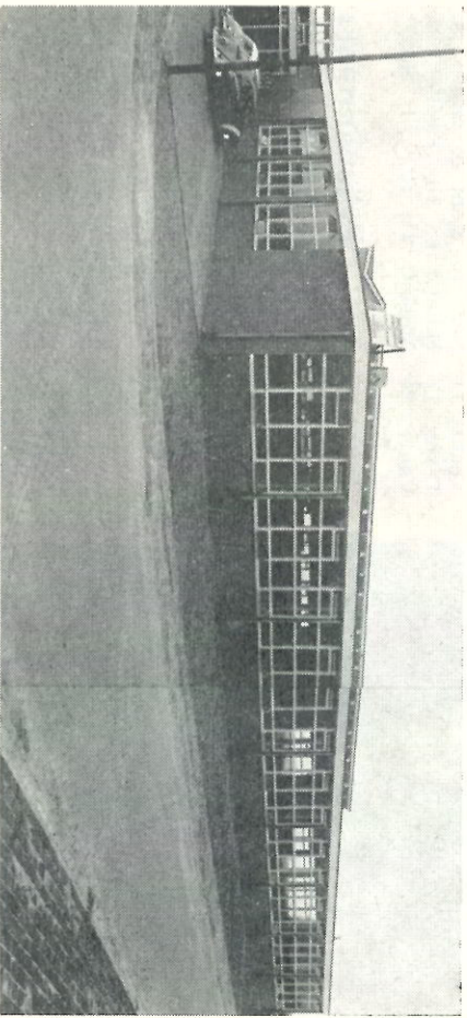
In vorige nummers brachten wij u op de hoogte van het oprichten door de N.V. Philips Gloeilampenfabrieken en Van der Heem N.V. van de Verenigde Stofzuiverfabrieken te Leeuwarden. Onlangs startten bij de V.S.F. de eerste werkmensen en de redactie vond dit een welkome gelegenheid deze foto te maken, waarop u de tijdelijke vestiging in Leeuwarden ziet.